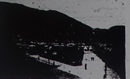
Plaza de Armas de Taltal, ciudad que recibió fuertes daños por efectos del terremoto.

BODEGA CON DESVIO necesito arrendar para MATERIALES. Ofertas: CASILLA 4521. Correo N.º 2.