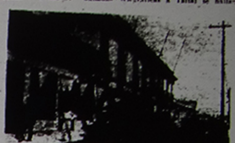
Un aspecto de la calle Atacama de Copiapo, ciudad que sufrió los efectos del terremoto.

tembló que el movimiento sísmico mayores caracteres de gravedad. — EL CORRESPONSAL. EL TEMBLOR EN TOCOPILLA TOCOPILLA, 12. — Intenso pánico produjo entre la población el temblor ocurrido a las siete y cuarto de la mañana, con una duración de dos minutos y medio. Este fenómeno no produjo perjuicios en las viviendas y habitaciones, ni tampoco desgracias personales. — MERINO, CORRESPONSAL.